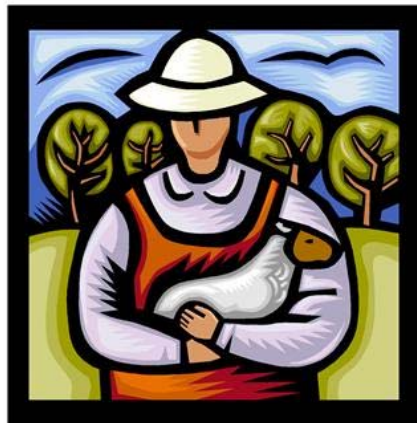
Figura relacionada com o projecto (é opcional, mas fica sempre bem)