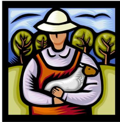
Figura relacionada com o projecto (é opcional, mas fica sempre bem)